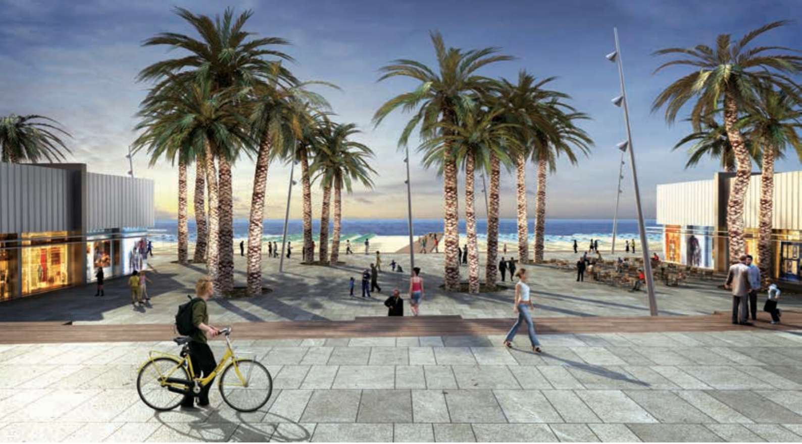
למעלה: טיילת עירונית בחוף הצפוני בעמוד מימין: תכנית אסטרטגית למרחב החוף אשדוד על רקע תצ"א (2013)