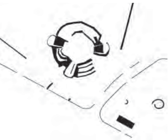
▲ שרידים במרחב

אבני קפיצה חוצות את הפלג, מייצרות משחק, וגומחה אקולוגית למינים מקומיים.