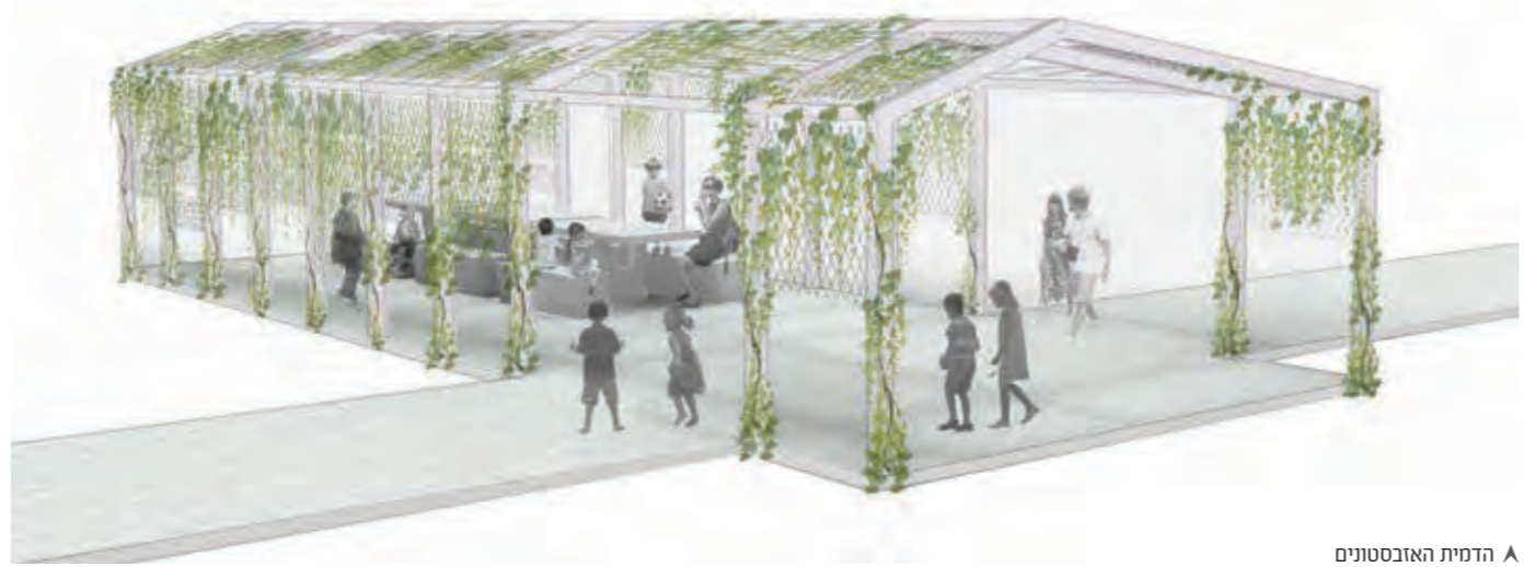
▲ הדמית האזבסטונים

המעלה, מאפשר רגע של תצפית ופתיחת מבט ותודעה רחבים. פיתחת הכניסה, הבנויה טרסות-טרסות לאורכן מתפתלת רמפה, שביל טיול בתוך גן עצי ושיחי פרי, כמעין "חפץ מעבר" היא מאפשרת להולך לעבור משאון העיר לרחש הטבע. לאורכה נקודות אתנחתא והתכנסות אישית ופנימית.