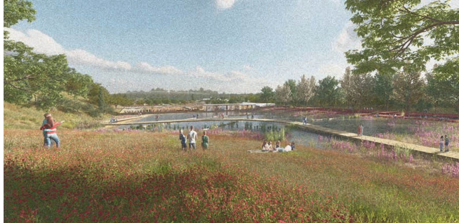
▲ מבט לאגם - ארי ברוק