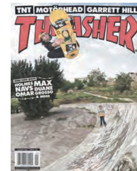
רמפת הסקיט מתוך מגזין סקיטבורד עולמי

מתחברים, אזורי אל-געעת של "שמורת אדם", מרחב הקהילה הקיימת היום בפארק - ערוגות שתילה, מקבצי סלעים לשיבה תחת חורשת חרובים, התה-אטרון הקהילתי ומטבח החוץ, נדנדה מאולתרת ואפילו רמפת הסקטבורד הראשונה בירושלים. פיסת גן