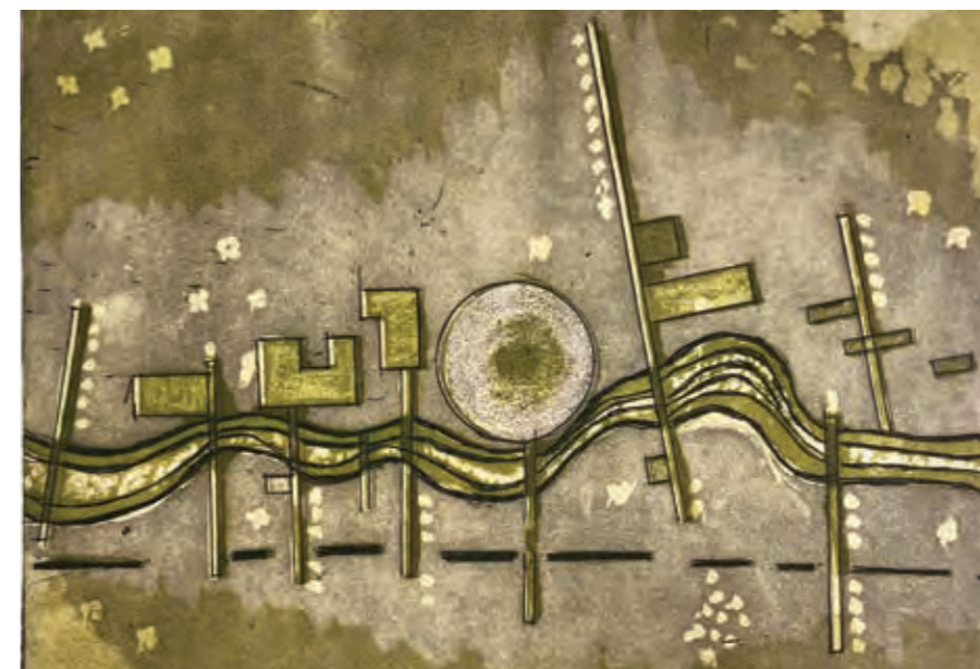
תחריט - סכמה לגן העץ

הפארק, חולף לצד בית הכנסת שנשאר בלב הוואדי מתקופת המעברה ומחבר את אזור ההיקוות. מחתך צר ומתכנס, הוואדי נפתח לחלל רחב ידיים.